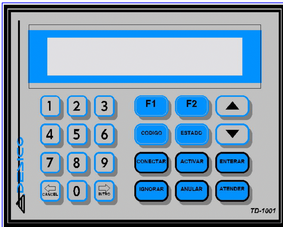
Figura 9 : Teclado de Supervisión Local

El Teclado de supervisión local, TD1001 está desarrollado con la finalidad de realizar las funciones básicas del sistema de supervisión y control Vigiplus , en una zona de la instalación en la que por sus características sea necesario tener un control del estado de la misma.